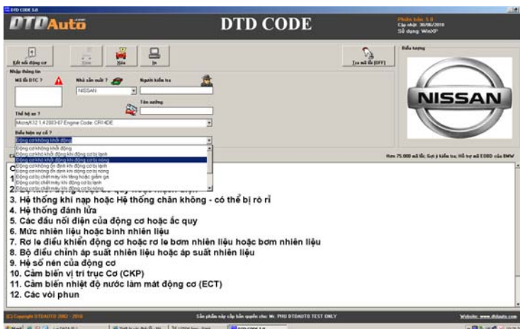
Giao diện phần mềm DTD Code